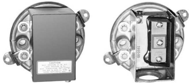
Abb. 1910 Gehäusekappe geschlossen, offen

Erhältlich auch mit Test-Zertifikat oder Prüf-Protokoll.