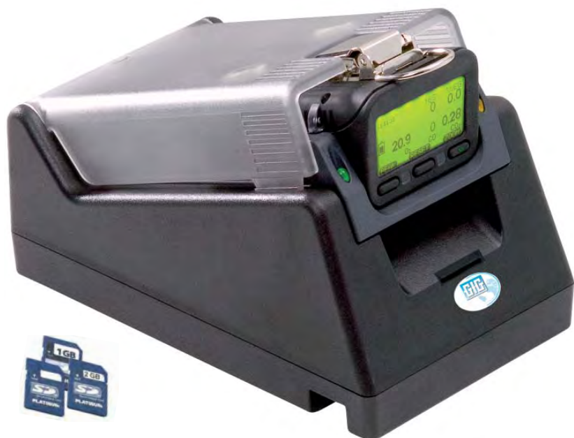
SD-Karten: permanente Datenerfassung für bis zu 30 Jahre Einsatzdauer

Die Daten werden für 30 Jahre auf einer SD-Speicherkarte aufgezeichnet. Die Datenübertragung an einen PC erfolgt durch Auslesen der Speicherkarte oder über die Schnittstelle an der Dockingstation.