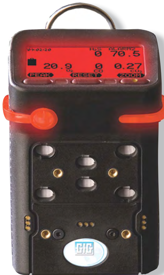
Originalgröße des G460

Außerdem zeichneten Anwender aus ganz Europa das G460 für seine