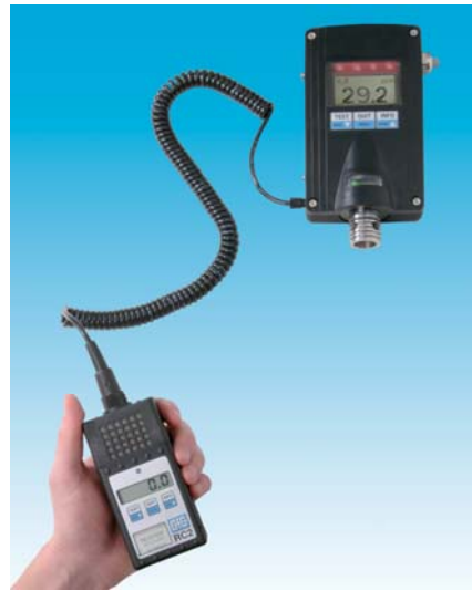
RC2 mit EC28 DA

Sekunden. Einstellungen werden direkt am Transmitter per Knopfdruck oder mittels Fernbedienung vorgenommen (Ein-Mann-Justierung).